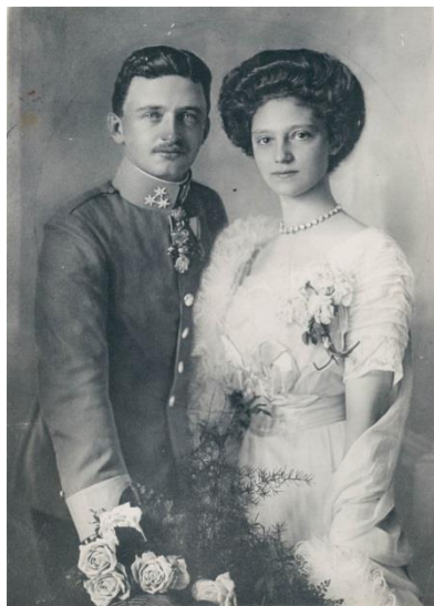
Karel a Zita jako snoubenci