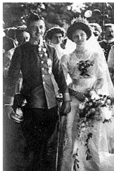
Karel a Zita – svatební obřad

Mladý pár žil v Brandýse a později i v haličské Kolomyji, Zitin manžel postupoval v hodnostech a funkcích, až se stal velitelem pluku. 20. listopadu 1912 se ve vile Wartholz u Reichenau an der Rax, Dolní Rakousko, manželům narodil první syn, arcivévoda Ota František Josef, v příštích deseti letech přišlo na svět ještě dalších sedm jeho sourozenců.